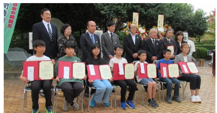
野間文庫読書推進賞受賞者