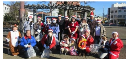
昨年の参加者たち