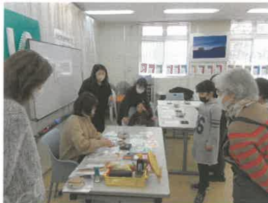
■寺子屋「パステルアート縁起だるまを描こう」