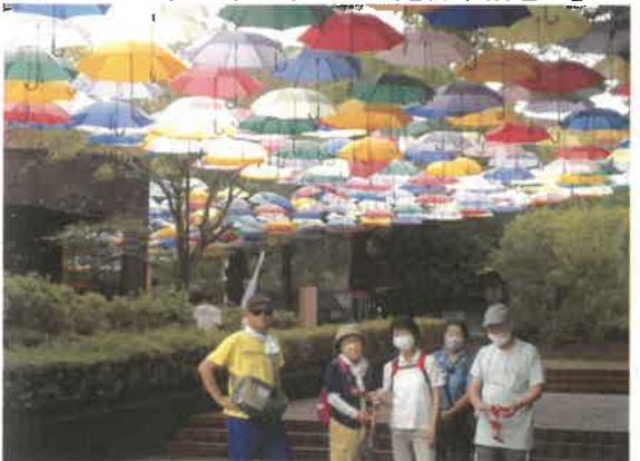
■健康づくりウォーキング「館林市城沼へ」