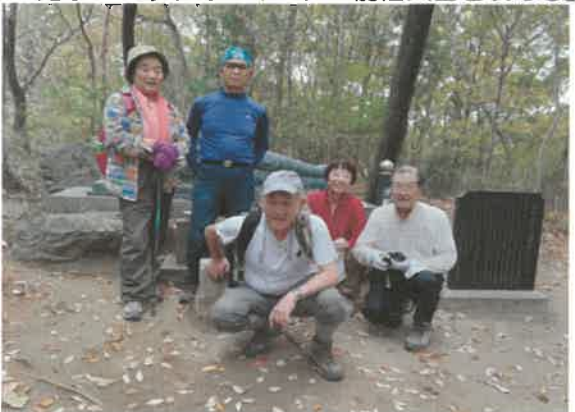
■健康づくりウォーキング「前仙人岳を攻める」