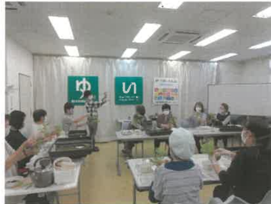
■寺子屋「苔玉づくり」