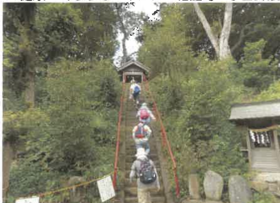
■健康づくりウォーキング「相生町一丁目界限」