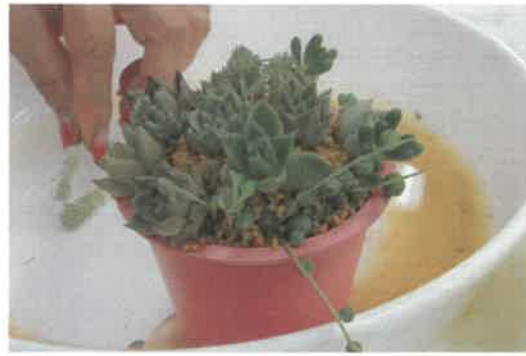
■寺子屋「多肉植物寄せ植え講座」