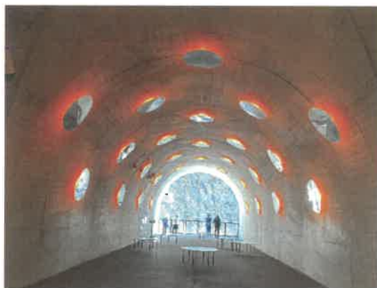
■新潟十日町博物館・清津峡視察研修