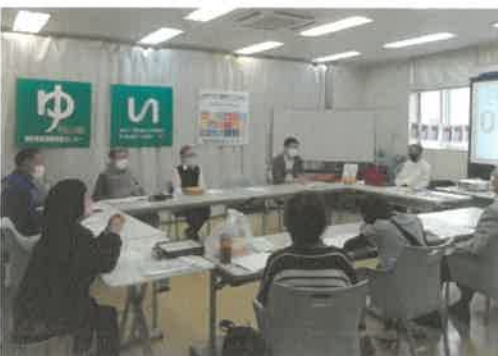
■寺子屋「ビブリオバトル」