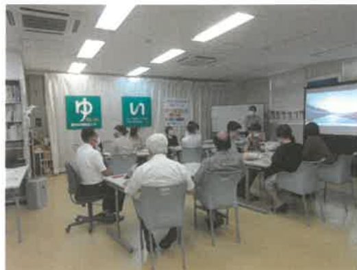
■ESD リレー講座「SDG sの取り組み」