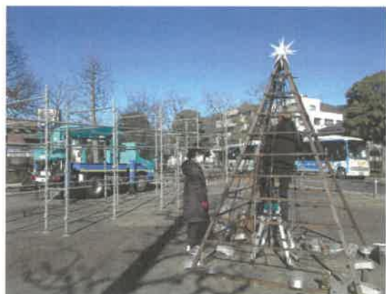
■北口イルミネーション撤去