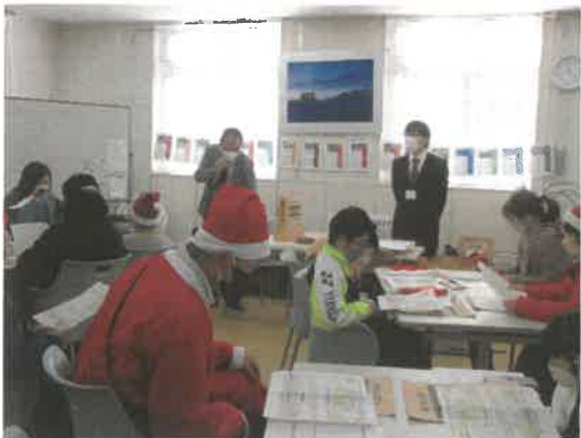
■ESD リレー講座「親子で学ぶゴミの分別」