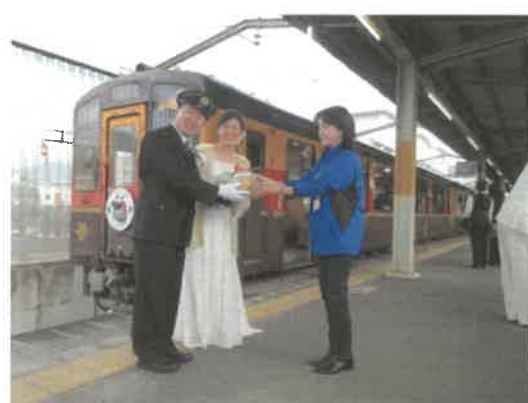
■わ鐵ウェディング列車