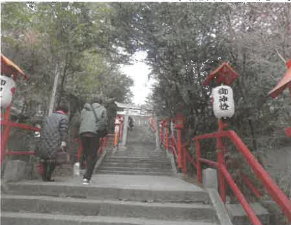
■健康づくりウォーキング「貴船神社～大間々駅」