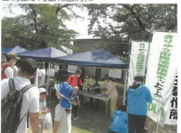
■桐生が岡動物園清掃