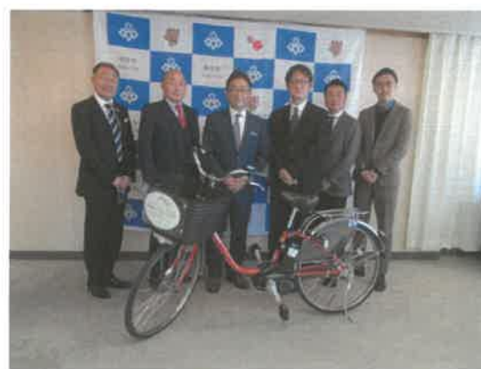
■神業ミュージアム自電車寄贈