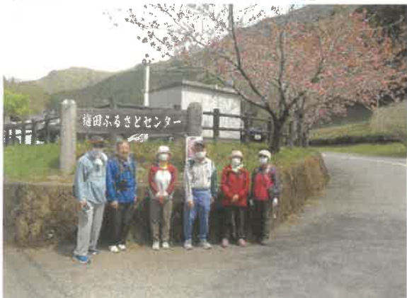
■健康づくりウォーキング「梅田路」