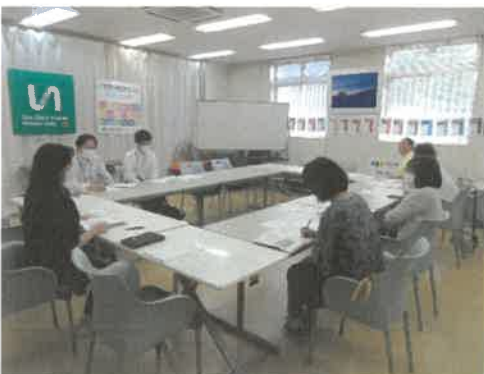
■パートナーシップづくり委員会