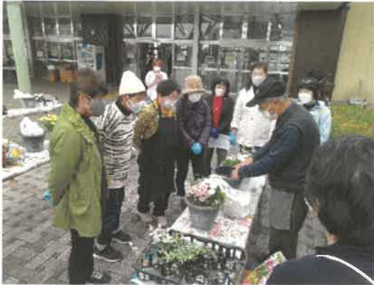
■寺子屋「寄せ植え講座」