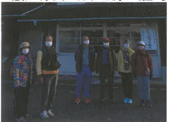
■健康づくりウォーキング「大間々～桐生へ歩く」