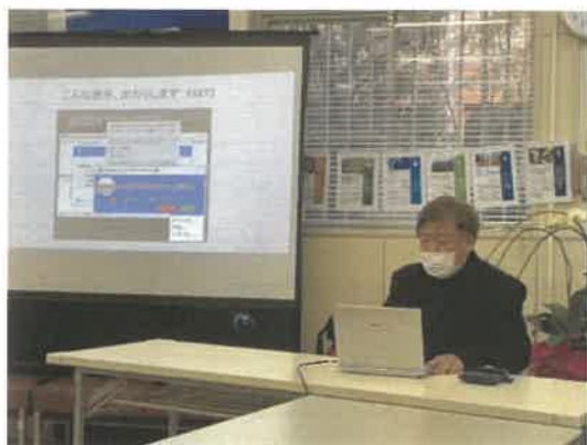
■寺子屋「パソコンセキュリティ講座」