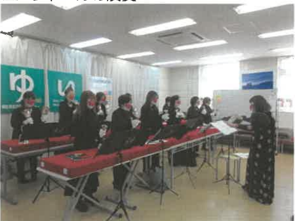
■ハンドベルの演奏